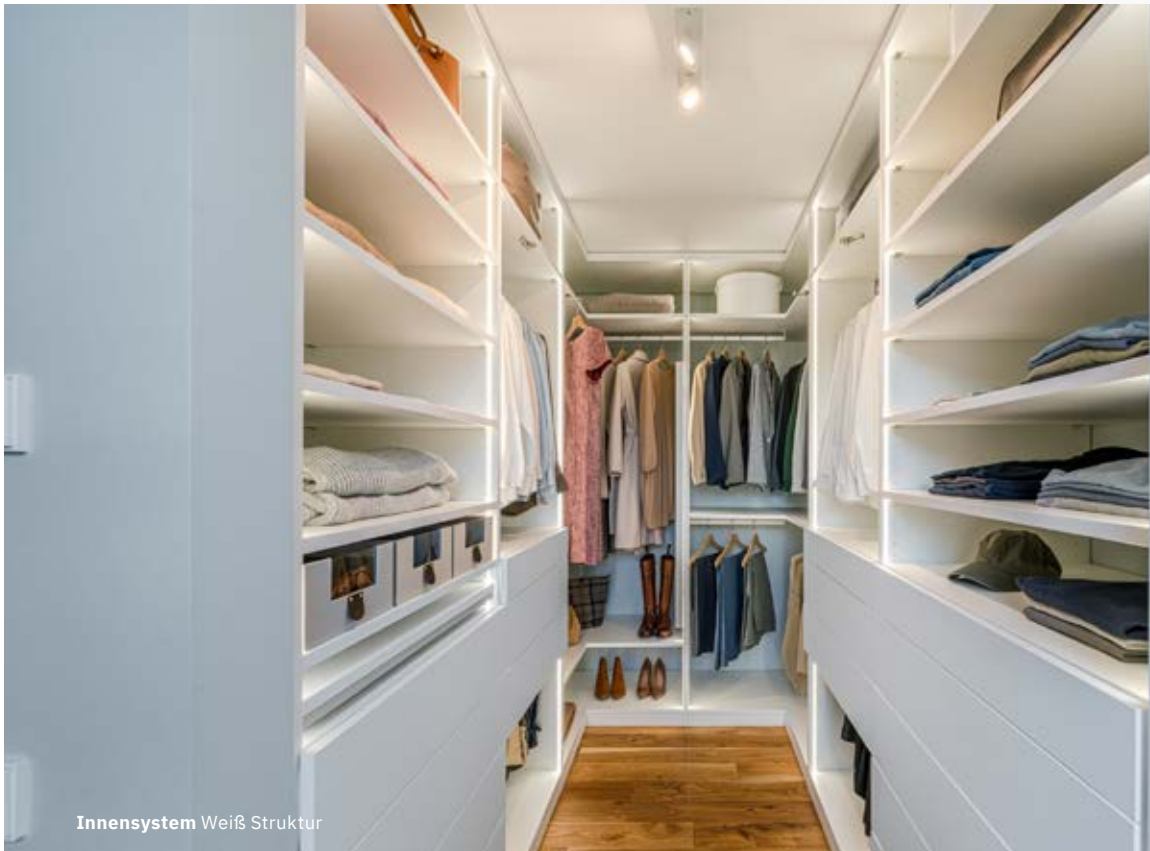
Innensystem Weiß Struktur