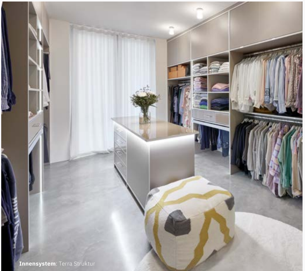
Innensystem: Terra Struktur