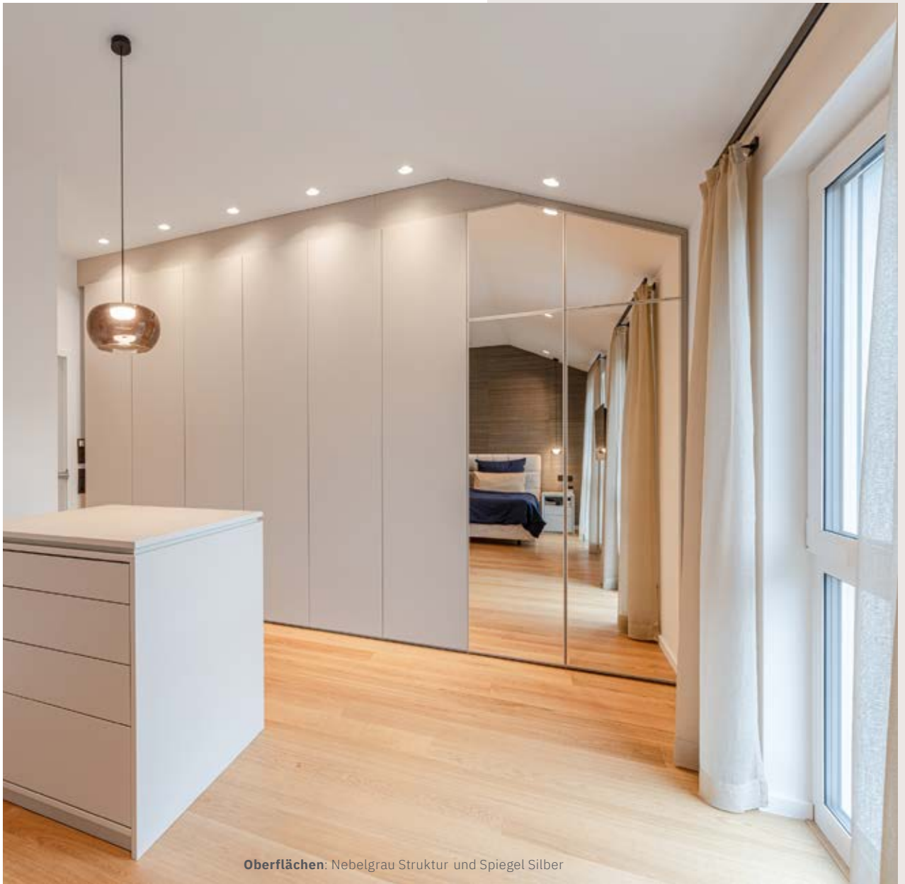
Oberflächen: Nebelgrau Struktur und Spiegel Silber