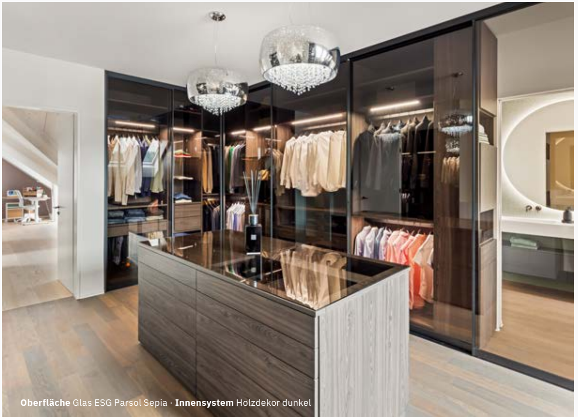
Oberfläche Glas ESG Parsol Sepia · Innensystem Holzdekor dunkel