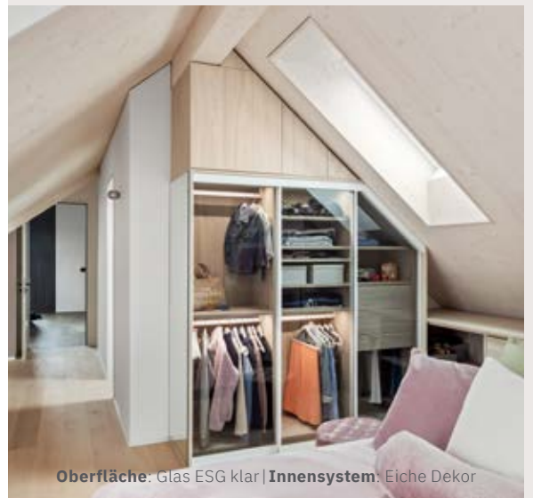
Oberfläche: Glas ESG klar | Innensystem: Eiche Dekor

Unsere maßgefertigten Schränke passen sich mühelos jedem Raum an, einschließlich schwieriger Bereiche wie Dachschrägen. Durch intelligente Planung und präzises Aufmaß nutzen wir jeden Millimeter optimal aus, um Ihnen maximalen Stauraum zu bieten.